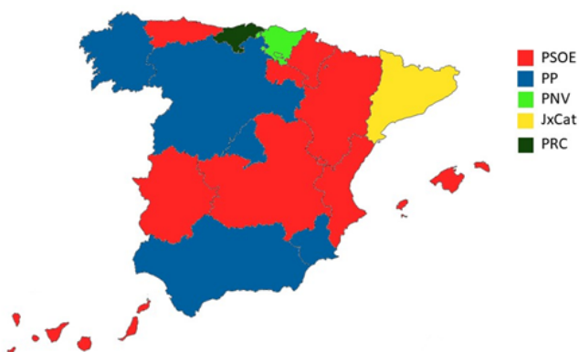
COMUNIDADES AUTÓNOMAS SEGÚN PARTIDO POLÍTICO GOBERNANTE